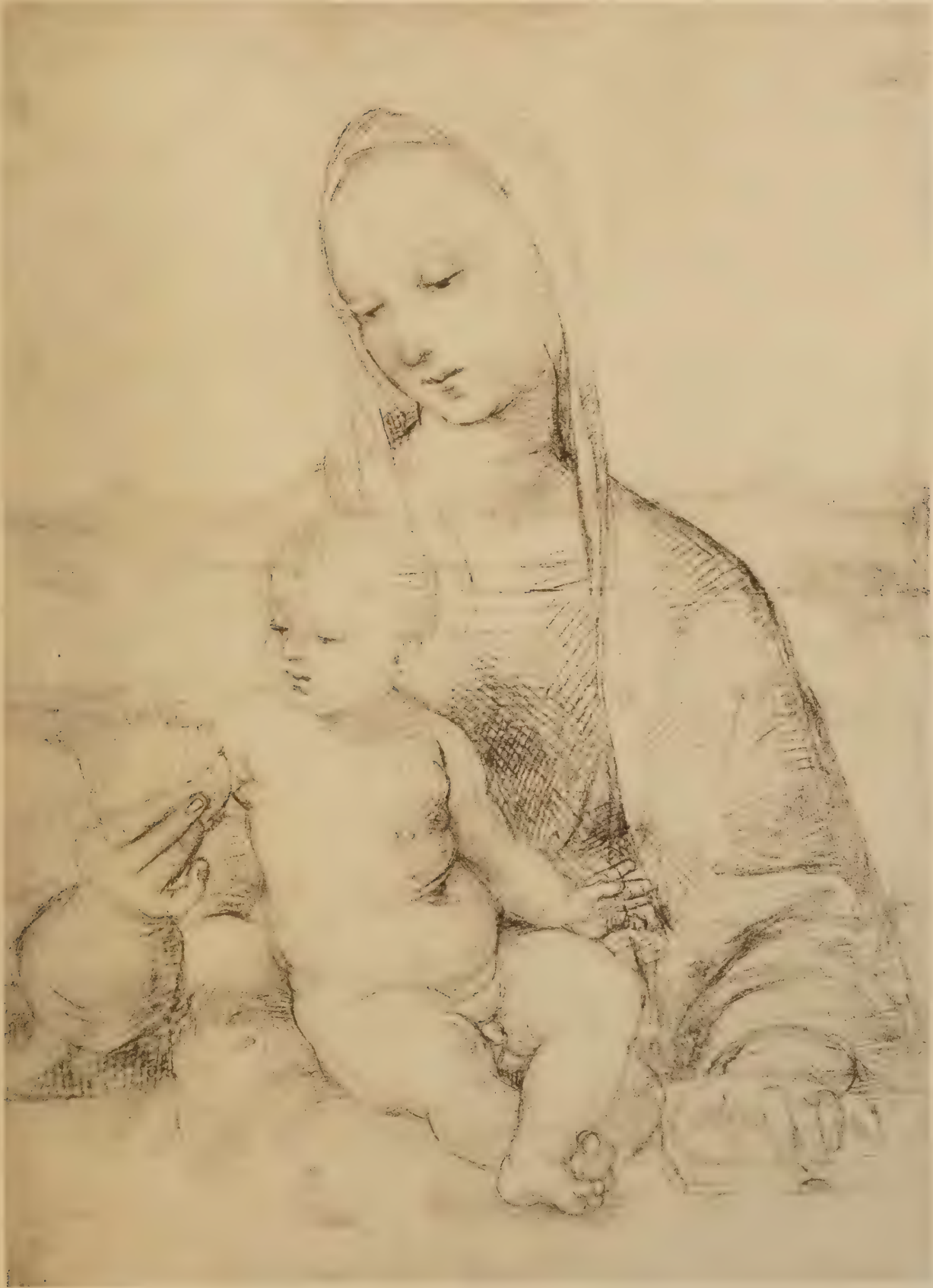
La Vierge et l'Enfant